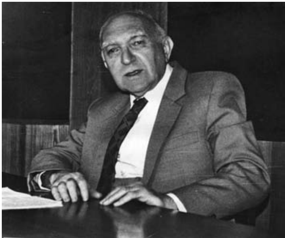
27 ოქტომბერს საქართველოს მეცნიერებათა ეროვნული აკადემიის სხდომათა დარბაზში ჩატარდება აკადემიკოს გიორგი ციციშვილის დაბადებიდან 95 წლისთავისა და მისი 70-წლიანი სამეცნიერო-საზოგადოებრივი მოღვაწეობის აღსანიშნავი იუბილე, რომელსაც საქართველოს უნივერსიტეტიდან და აკადემიის ინსტიტუტებიდან სამეცნიერო წრის წარმომადგენლები დაესწრებიან.

გიორგი ციციშვილი გახლავთ პეტრე მელიქიშვილის ფიზიკური და ორგანული ქიმიის ინსტიტუტის საპატიო დირექტორი, აგრეთვე საქართველოს მეცნიერებათა ეროვნული აკადემიის აკადემიური საბჭოს მრჩეველი. 1940 წლიდან იგი ათეული წლის განმავლობაში მუშაობდა ივანე ჯავახიშვილის სახელობის თბილისის სახელმწიფო უნივერსიტეტში და უანგაროდ ემსახურებოდა ქიმიკოსთა ახალგაზრდა თაობის აღზრდას. გიორგი ციციშვილი სათავეში ედგა საქართველოში ქიმიისა და ქიმიური ტექნოლოგიების განვითარებას. დღეისათვის მისი ნაწილობრივი ნივთიერების აღნაგობის შესწავლასა და სორბციული პროცესების კვლევის დარგში. მის მიერ არის შექმნილი საქართველოში სორბციული პროცესების კვლევის სკოლა, რაც არაერთხელ აღნიშნა მსოფლიოში ცნობილმა მეცნიერმა, აკადემიკოსმა მიხეილ დუბინინმა.