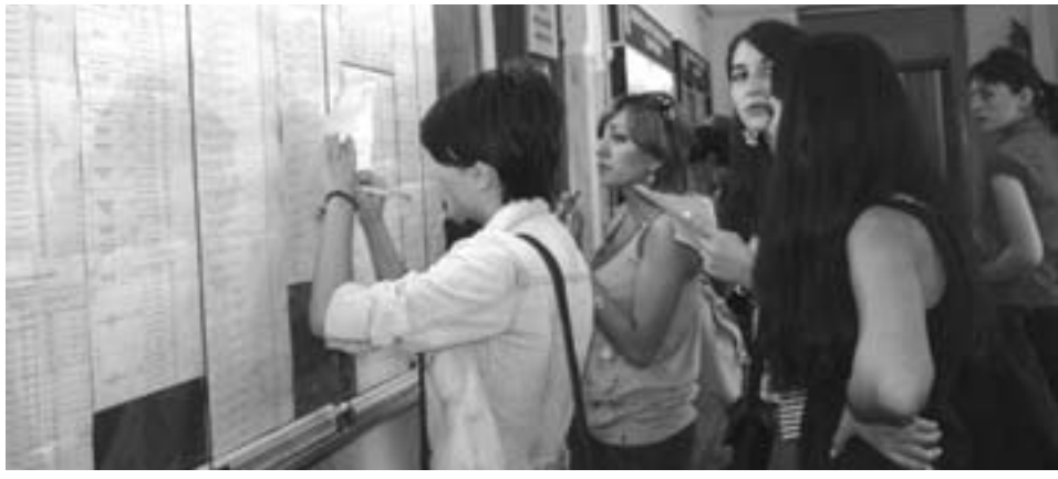
სტუდენტთა მომსახურების ცენტრებმა ფუნქციონირება მიმდინარე წლის 26 აპრილიდან დაიწყეს. მომსახურების ცენტრის ფუნქციებში შედის სტუდენტების კითხვებზე პასუხის გაცემა პირადად, ტელეფონით და ელექტრონული ფოსტის მეშვეობით, ასევე, კონსულტაციის განევა – ვის უნდა მიმართონ მათ ამა თუ იმ პრობლემის მოსაგვარებლად.

ჯერ დეკანატმა გადაგზავნა გვიან, შემდეგ სასწავლო დეპარტამენტში გააჭიანურეს გადამოწმება, გუშინ ვისთან არ მივედი, მაგრამ ვერაფერს ვამცა ნორმალური პასუხი – რატომ არ მაძლევენ აკადემიური ხარისხის მინიჭების შესახებ ცნობას დროულად, არადა ეს ცნობა თუ არ მივიტანე, სწავლას ვერ გავაგრძელებ იმ სასწავლებელში, სადაც მინდა. ვადა 10 სექტემბერს იწურება. დღესაც დავრეკე სასწავლო დეპარტამენტში და ისევ უარი მითხრეს იმ მიზეზით, რომ ჯერ არ დაწყებულა ასეთი ცნობების გაცემა ჰუმანიტარულ მეცნიერებათა ფაკულტეტის 2010 წლის კურსდამთავრებულებზე, არადა მაქვს იმ ცნობის ასლი, რომელსაც ვითხოვ და რომელიც გაიცა ზუსტად ამ წლის კურსდამთავრებულ სტუდენტზე“ (7 სექტემბერი, K.N.).