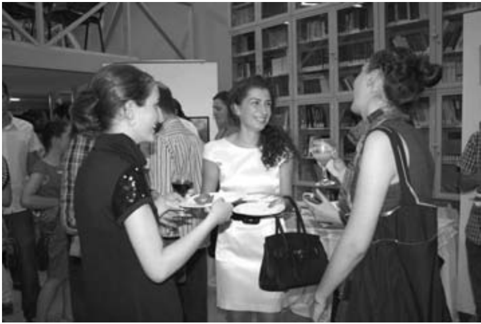
22 სექტემბერს თსუ-ის სტუდენტურმა თვითმმართველობამ თბილისის სახელმწიფო უნივერსიტეტში ჩარიცხულ საუკეთესო რეიტინგის მქონე 80 პირველკურსელს უმასპინძლა. წვეულაზე ექვსივე ფაკულტეტის დეკანი, ადმინისტრაციის წარმომადგენლები და თსუ-ის რექტორის მოვალეობის შემსრულებელი სანდრო კვიციანი დაესწრნენ. სტუდენტებს მათთან პირადად გასაუბრების საშუალება მიეცათ და საინტერესო შეკითხვებზე ამომწურავი პასუხებიც მიიღეს.